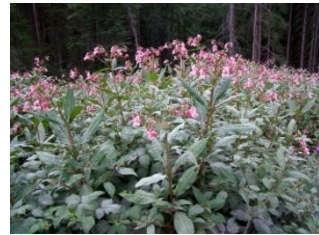
Drüsige Springkraut ( Impatiens glandulifera )

Die hier abgebildeten Pflanzen sind für Sie nicht gefährlich. Durch Ausreissen und korrektes Entsorgen helfen Sie mit, deren unkontrollierte Ausbreitung einzudämmen.