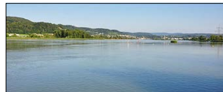
Am Klingnauer Stausee mit dem Insekten-Flugsimulator abheben.