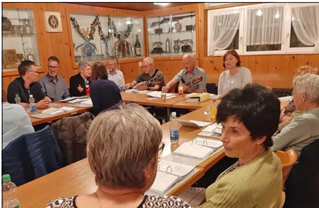
Das letzte Singen am 19. Mai fand in der Schützenstube Wauwil statt.