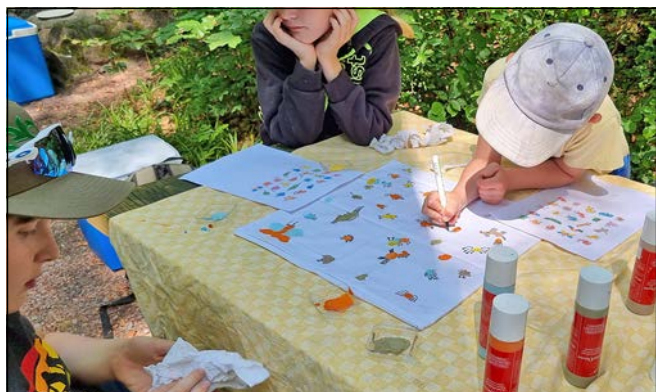
Nicht alle Tiere auf dem Kissenbezug sind am Santenberg zu beobachten.