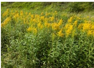
Kanadische Goldrute ( Solidago canadensis )