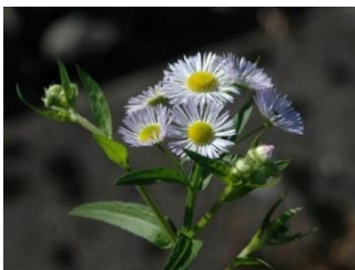
Einjähriges Berufkraut ( Erigeron annuus )

Finden Sie auf ihrem Grundstück oder bei einem Spaziergang die nachfolgend abgebildeten Pflanzen, dann reissen Sie diese mitsamt den Wurzeln aus. Sammeln und entsorgen Sie die Pflanzen in einem Neophyten- oder Abfallsack. Bei einer Wanderung auf dem Santenberg können die Pflanzen im Neophytenbehälter beim Parkplatz Allmend entsorgt werden.