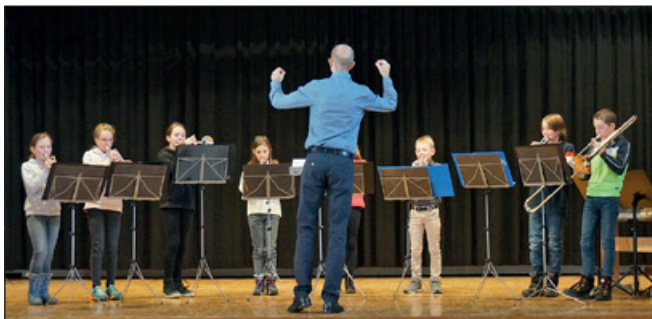
Die Beginnersband Crescendo am letztjährigen Konzert in Geiss.

Es erwartet Sie ein Potpourri aus farbigen herbstlichen Klängen mit verschiedensten Musikformationen. Geniessen Sie einen musikalischen Abend zusammen mit unseren Musikschüler:innen und deren Musiklehrpersonen. Wir freuen uns auf Ihren Besuch.