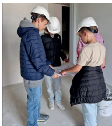
Planlesen auf der Baustelle

In der Woche vom Montag, 23. September bis Freitag, 27. September fand an der Schule Wauwil für die 2. Sekundarstufe die Berufswahlwoche statt. Die Ziele dieser Woche waren, eine vollständige Musterbewerbung zu erstellen, die eigenen Auftrittskompetenzen zu verbessern und das Wissen über die Berufswelt zu erweitern. So konnten die Lernenden wertvolle Kenntnisse und Fähigkeiten für ihr zukünftiges Berufsleben erwerben.