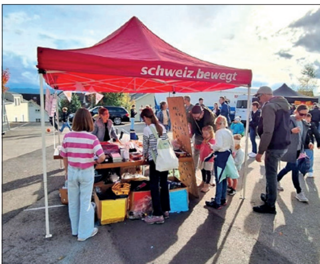
Kilbistand der 5./6. Klassen