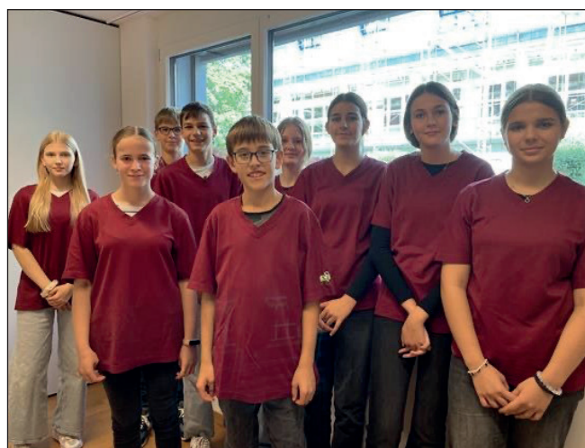
Bei der Physio