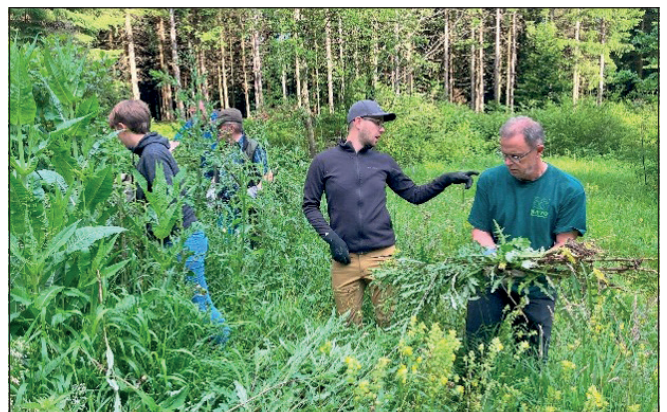
Handschuhe empfohlen: stachelige Ackerkratzdisteln ausreissen im Lättloch.