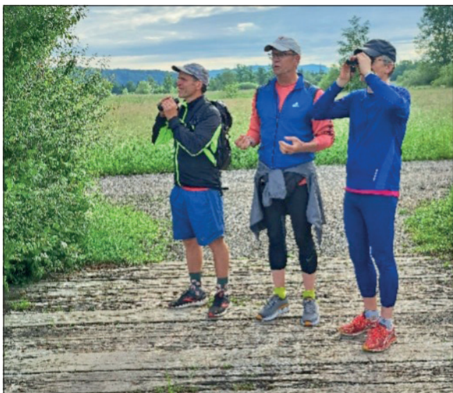
Ornithojogger beobachten.

Besondere ornithologische Leckerbissen waren ein rasender Rotfussfalke, eine singende Grauammer oder etwa ein ansitzendes Neuntöter-Pärchen. Auch einem Feldhasen schauten wir gerne zu.