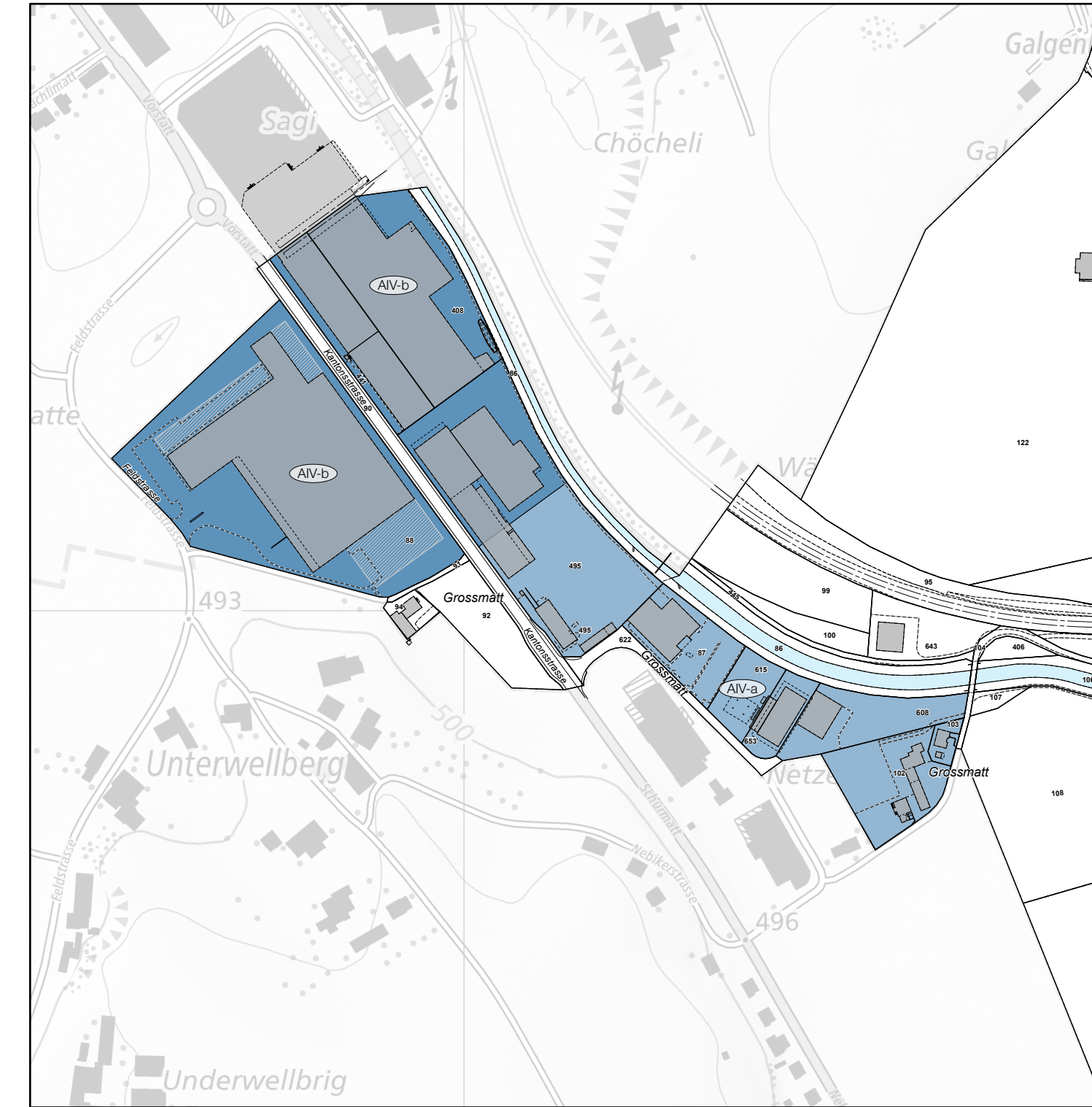
Ausschnitt mit Änderungen (Gegenstand der 2. öffentlichen Auflage) «Differenz»