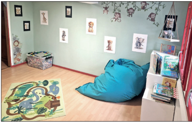
Einblick Räumlichkeiten Tagesstrukturen