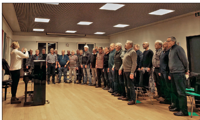
Impressionen von den gemeinsamen Proben.