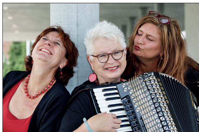
Charmant und lebensfroh begeistern diese «Krause Glucken» ihr Publikum.

Bitte diesen Event in Ihrer Agenda vormerken und vielleicht jemanden als schönes Geschenk zu Weihnachten oder einem Jubiläum beglücken. Der Verein Spektrum Egolzwil-Wauwil freut sich auf zahlreiches Publikum.