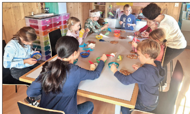
Lebkuchen verzieren für den Adventsmarkt

Nun freuen wir uns auf die bevorstehende Weihnachtszeit, denn da wird besonders viel gebastelt und gebacken in unserem kleinen Knusperhäuschen.