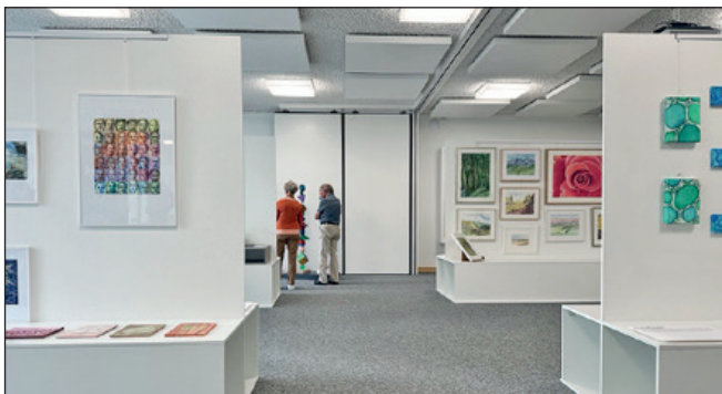
Blick in den Ausstellungsraum mit Besuchenden, die die Installation der Schulkinder betrachten.

Vom 28. bis 30. September 2023 fand in Egolzwil die Kunstaussstellung «Grow with the Flow» mit 7 Kunstschaffenden mit Egolzwiler und Wauwiler Wurzeln statt. Die Ausstellung, organisiert vom Verein «Kultur im Zentrum», wollte den lokalen Künstler:innen eine Plattform geben, ihr kreatives Schaffen ins Zentrum rücken und als Grundlage für Gespräche über das Dorfleben und die Umgebung nutzen. So konnten am ersten Ausstellungstag die Schulkinder und Lehrpersonen als erste Gäste empfangen und durch die Ausstellung geführt werden. Die Kinder waren begeistert von den Arbeiten und als sie gar ihre eigenen Werke als Teil der Ausstellung entdeckten, waren sie auch ganz schön stolz. Im Verlauf des restlichen Tages kamen dann noch weitere Besuchende vorbei. Der erste Tag war somit erfolgreich über die Bühne gegangen.