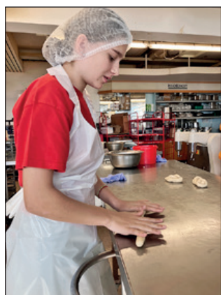
In der Bäckerei