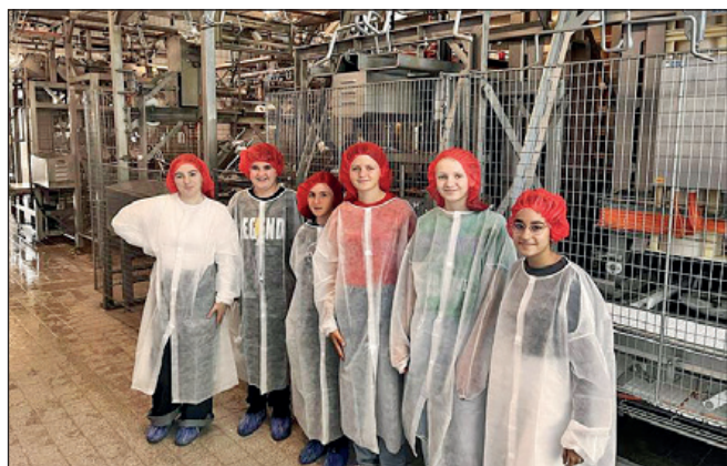
MilchtechnologInnen in der Emmi, Kaltbach

Am zweiten Tag fand bereits zum 9. Mal der Berufserkundungsparcours in Zusammenarbeit mit dem Gewerbe Wauwil/Egolzwil statt. Von insgesamt 22 Berufen durften alle Lernenden der 2. ISS je zwei selbstgewählte Arbeitsbereiche näher kennenlernen – einen am Mor-