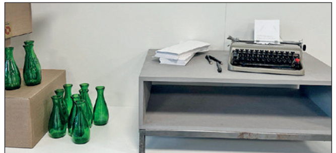
Ausstellungsansicht, Installation «Flaschenpost» von Italo Fiorentino.