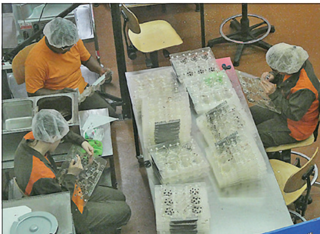
Handarbeit beim Herstellen von Schoggihasen