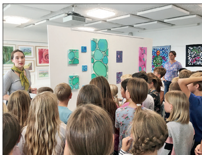
Eintauchen in die Ausstellung «Grow with the flow»

Mit unseren farbigen Tieren möchten wir die Zuschauer daran erinnern, dass die Zukunft der Menschen und Tiere heute beginnt. Nicht erst, wenn Wasser, Luft und Erde so verschmutzt sind, dass sie nicht mehr als gesunde Lebensumgebung dienen können.