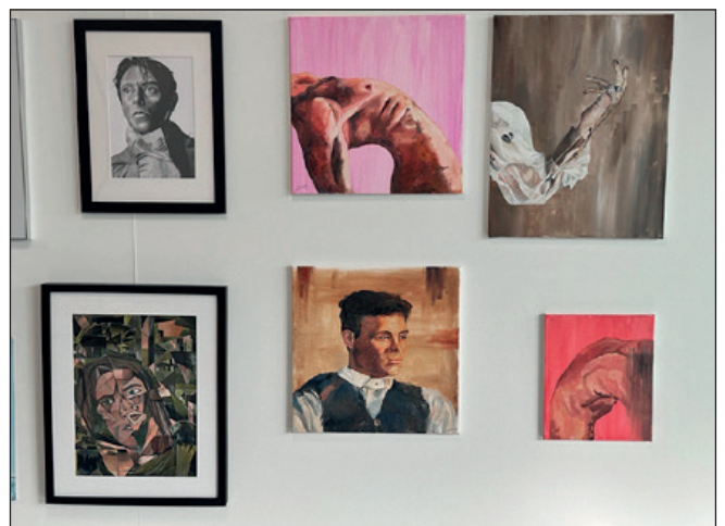
Ausstellungsansicht, Blick auf einen Teil der Werke der Künstlerin Jana Vonmoos.