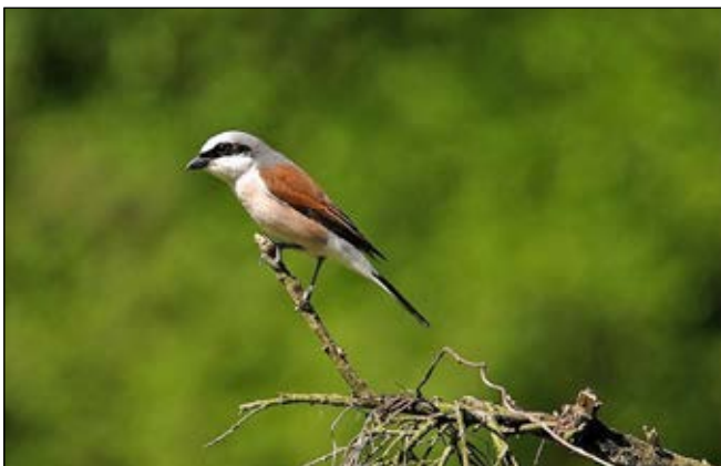
Foto: Neuntöter (Leitart in Netz Natur Santenberg und Vogel des Jahres 2020)

Die Kommission Netz Natur Santenberg und die beteiligten Landwirte laden jedermann herzlich ein.