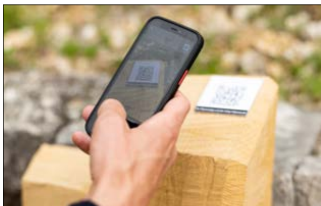
Eine Stele mit QR-Codes, über welche mehr über den Ort in Erfahrung gebracht werden kann.