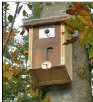
Ein modifizierter neuer Kasten

Zum Schluss ein kleiner Nistkastenwettbewerb