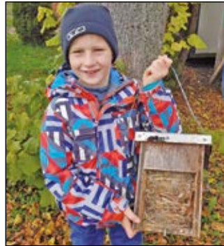
Das unordentliche Napf- nest eines Feldsperlings

Einige Nistkästen sind seit über 30 Jahren im Einsatz. Gelegentlich müssen wir daher Kästen ersetzen. Aus einem Nachlass haben wir diesen Herbst viele Nisthilfen erhalten. Wir mussten diese etwas modifizieren, da einige Teile aus Verbundwerkstoffen (MDF, OSB) bestanden. Ganz im Sinne von «Verwenden statt verschwenden» haben wir diese mit alten Honigraumzargen aus der Imkerei paronihonig ergänzt. Wir decken das Dach zusätzlich mit einem Alublech, um den Kasten optimal vor Nässe zu schützen. Für neue Nisthilfen eignet sich massives Fichten- oder Tannenholz.