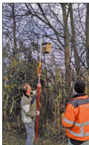
Einsatz der Teleskopstange

Wirklich spannend wird's beim Öffnen der Kästen. Was oder wer kommt zum Vorschein? Von leeren Kästen, verlassenem Wespen- und Hornissennestern, über fein gestrickte Meisennester, schlafenden Haselmäuse und chaotische Feldsperlingszimmer ist alles dabei. Auch verlassene Eigelege