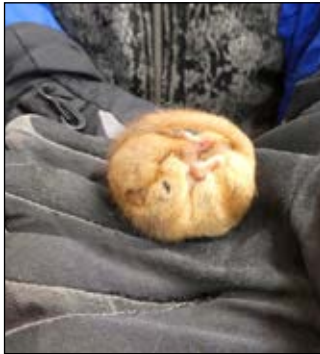
Schlafende Haselmaus

und tote Jung- oder Alt-Vögel findet man gelegentlich. Wir führen Buch über die ehemaligen und aktuellen Bewohner und melden diese Daten an Birdlife. Die alten Nester werden entfernt und der Kasten wird mit einem Spachtel geputzt.