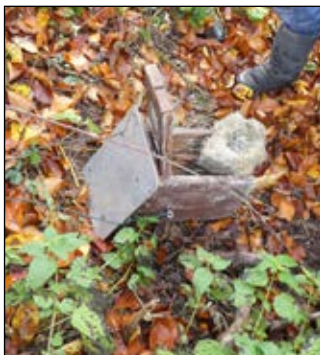
Der feine Nestbau einer Meise

Sie möchten sich auch bei uns engagieren? Unsere Aktivitäten finden Sie auch auf www.navowauwilegolzwil.ch . Die nächste «Nistkasten-Putzete» findet am Samstag, 5. November 2022 statt.