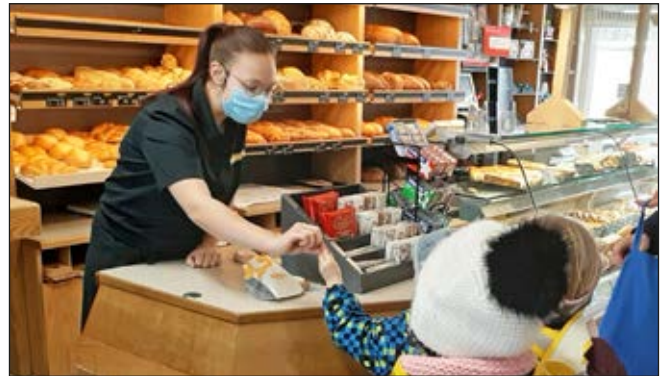
Nach der Brötliwahl wird bezahlt und das Brötli in einer Tüte übergeben.