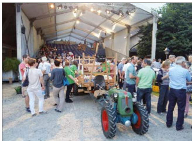
Zuschauer vor Theaterbühne in der Pause.