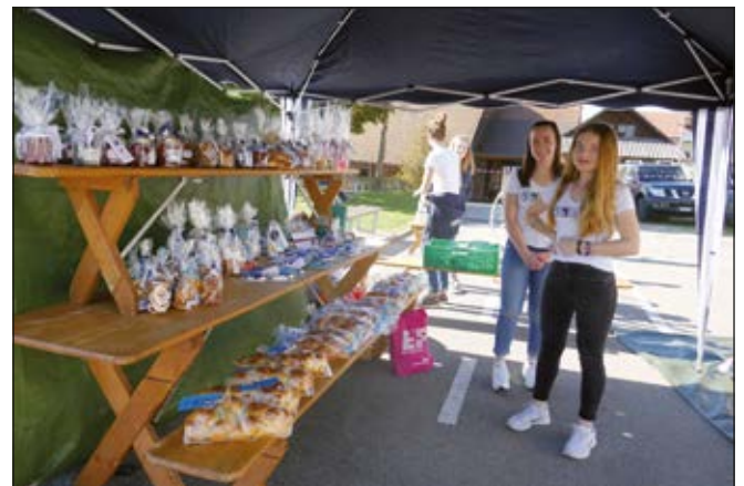
Die Mädchen vom Blauring Eglzwil-Wauwil präsentieren stolz die selbstgemachten Lospreise.