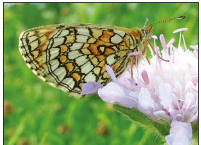
Ein naturnaher Garten ist Lebensraum für eine Vielzahl von Lebewesen!