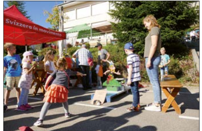
Am Stand der Schule Eglzwil zeigen die jungen Kilbibesucher ihre Treffsicherheit beim Mohrenkopfschiessen.

CVP punktete derweilen mit ihrer legendären Kegelbahn. Zu den Standbetreibern zählten auch der Fussballclub Wauwil-Eglzwil, der Männerchor Eglzwil-Wauwil, die Schule Eglzwil, der Natur- und Vogelschutzverein Wauwil-Eglzwil und Umgebung (NAVO), die Jungwacht Eglzwil-Wauwil und die Trachtengruppe Eglzwil-Wauwil.