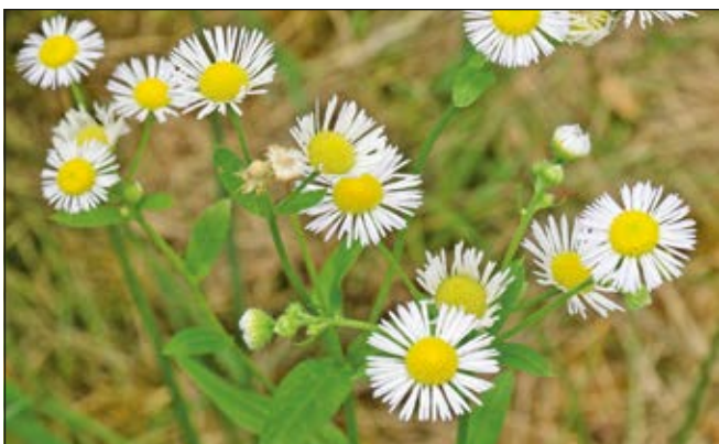
Einjähriges Berufkraut ( Erigeron annuus )

Zahlreiche heute für uns wichtige Pflanzen stammen ursprünglich von anderen Kontinenten. Beispielsweise Kartoffeln, Kastanien, Reben, oder auch kultivierte Apfelsorten. Eine Vielzahl solcher Pflanzen bereichert heute unser Leben und begeistert uns mit ihren Blüten, Früchten oder Knollen. Von dieser Vielfalt an eingeführten Pflanzen sind einige wenige Arten, welche sich invasiv verbreiten. Diese können unter Umständen ganze Ökosysteme verändern, heimische Arten verdrängen und die Artenvielfalt reduzieren. Sie können aber auch grosse Schäden in der Forst- und Landwirtschaft verursachen.