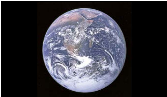
«The blue marble», die erste Aufnahme der Erde aus dem Weltall. (Apollo 17 Mission, 7. Dezember 1972)